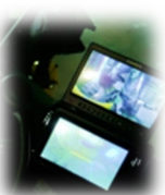
設置したモニター

運転席にモニターを設置し「前方」「後方」「アーム」の近くが見えるようになっていきます。