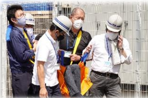
負傷者を担架で移動中